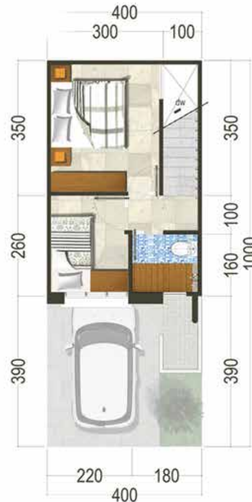
3 rd Floor